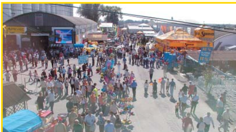
Sajam u Gudovcu

Ove godine na sajmu se posjetiteljima predstavilo pet županija i čak deset stranih zemalja, koje su organizirale pre-