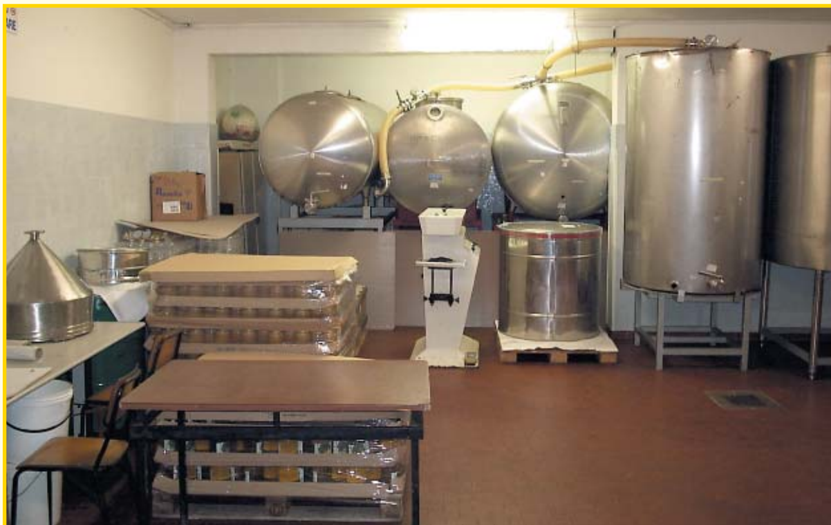
Pogon za vranje, skladištenje i punjenje meda

EU provodi poljoprivrednu reformu kojoj je namjera izraditi zakonsku regulativu koja će biti ista za sve članice, jer nije logično da jedna zemlja