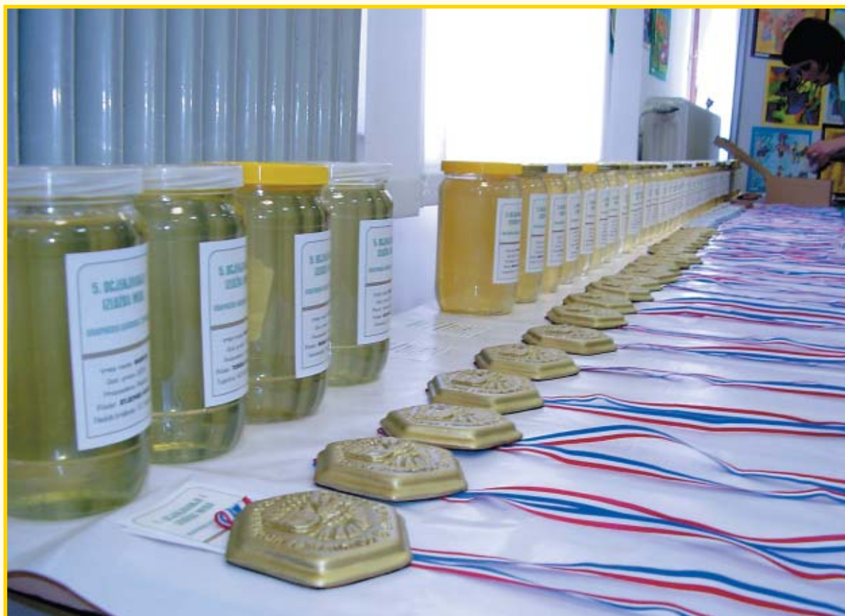
Odličja i nagrađeni medovi