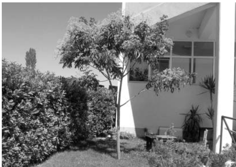
Stablo evodije

Prije nekoliko godina Pčelarska udruga «Pčela» iz Čapljine pokrenula je veliku akciju sadnje medonosnog bilja, koju je vodio moj prijatelj pčelar Mile Pehar. Tom mi je prigodom poklonio nekoliko sadnica raznih medonosnica (bagrem, lipa, gledičija), među kojima su bile i dvije sadnice evodije. Sve sam ih posadio u pčelinjaku. Prošle godine polovicom srpnja jedna od evodija je procvjetala (u 4. godini) i od prvoga dana cvjetanja pčele su je u sve većem broju posjećivale, od jutra do večeri,