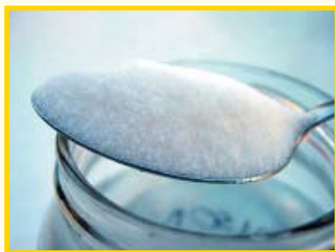
Saharoza - konzumni šećer