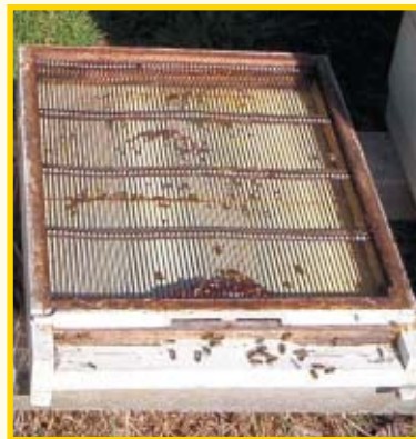
Matična rešetka na podnici

Dolaskom hladnih dana pčele sve više vremena provode zbijene oko preostalog legla, a na izlete se odlučuju tek u najtoplijem dijelu dana. Spremaj se za dolazeću zimu. Ali, nisu samo one osjetile da nam se približava zima, i ostale životinje koje žive na pčelinjaku pokušavaju sebi pronaći mjesto pogodno za zimovanje. To su, prije svega, roščica i miš, a košnica im je pogodno mjesto za to, jer se oni hrane pčelama, ali neće odoljeti ni medu i vosku. Zato, kada se ovi štetnici uvuku u košnicu, u njoj ostaju do kraja zime, švrljajući ondje, prljajući je i, što je najgore, uznemiravaju pčele u doba kada su one u klupku. Pčelinja zajednica koja ima takvog neželjenog gosta teško će prezimiti, u proljeće će ući veoma slaba, ako ga dočeka.