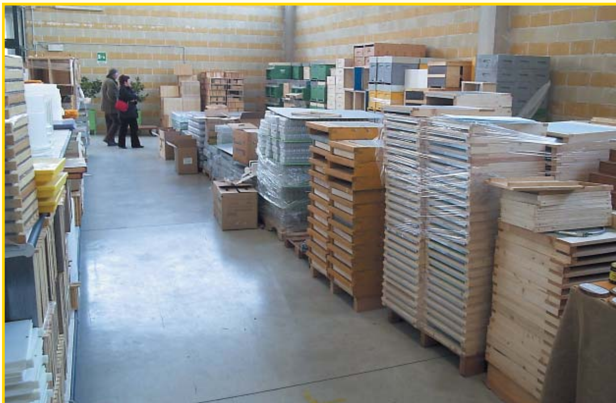
Proizvodnja pčelarske opreme

Osim što Italija ima 1.100.000 košnica, talijanski pčelari proizvode tek 10 do 15% meda za vlastite potrebe, a ostalo uvoze. Upravo taj podatak upućuje na mnoge zanimljive čimbenike. Kao prvo, mogao bi se steći dojam da talijanski pčelari nemaju problema s plasmanom svojih proizvoda, što i nije istina. Naime ta-