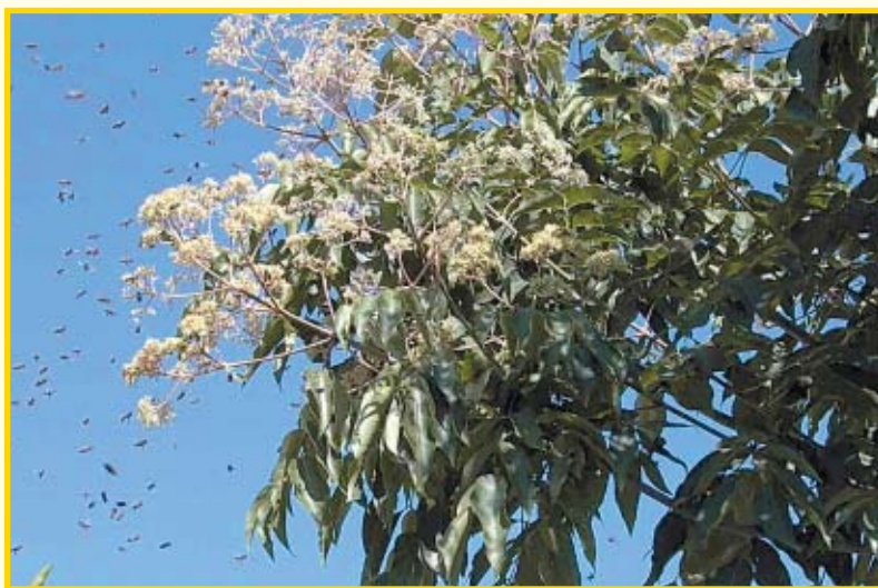
Pčele na cvjetovima evodije

značajnija medonosna vrsta Evodia hupehensis , koja je davno prenesena u Europu. U Mađarskoj je ima dosta, pa se smatra da je odatle stigla i u naše krajeve.