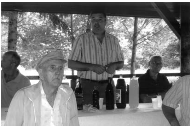
Susret čazmanskih pčelara

Uobičajeni susret i savjetovanje čazmanskih pčelara, održan je i ove godine na starome mjestu, u velikoj drvenoj sjeni-