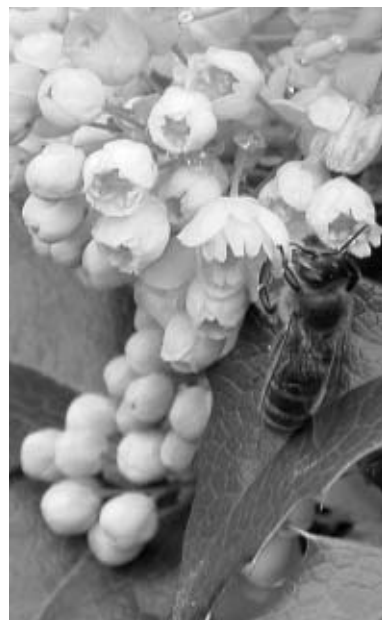
Nektar - najprirodnija hrana za pčele