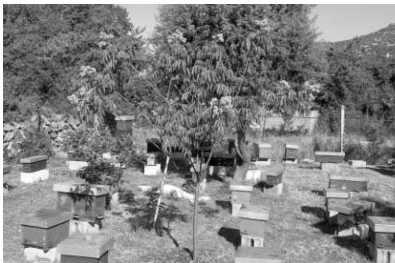
Evodija u pčelinjaku

Botanički rod u koji spada evodija obuhvaća oko 50 vrsta pretežito niskog drveća ili grmova. Prirodno se rasprostranjuje u Jugoistočnoj Aziji, Australiji i Polineziji. U Kini raste 20-ak vrsta iz tog roda. Među njima za pčelare je naj-