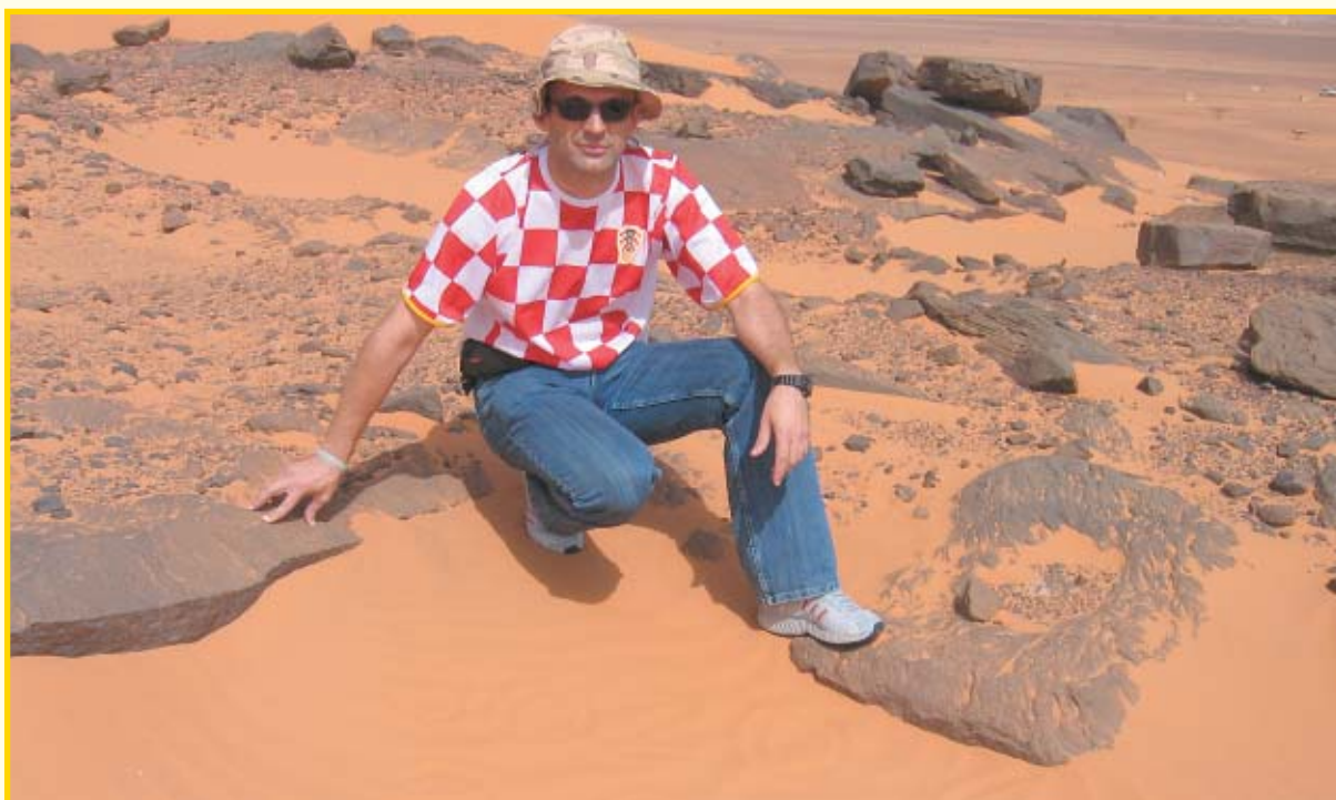
Hrvatski pčelar u mirovnoj misiji u Sudanu