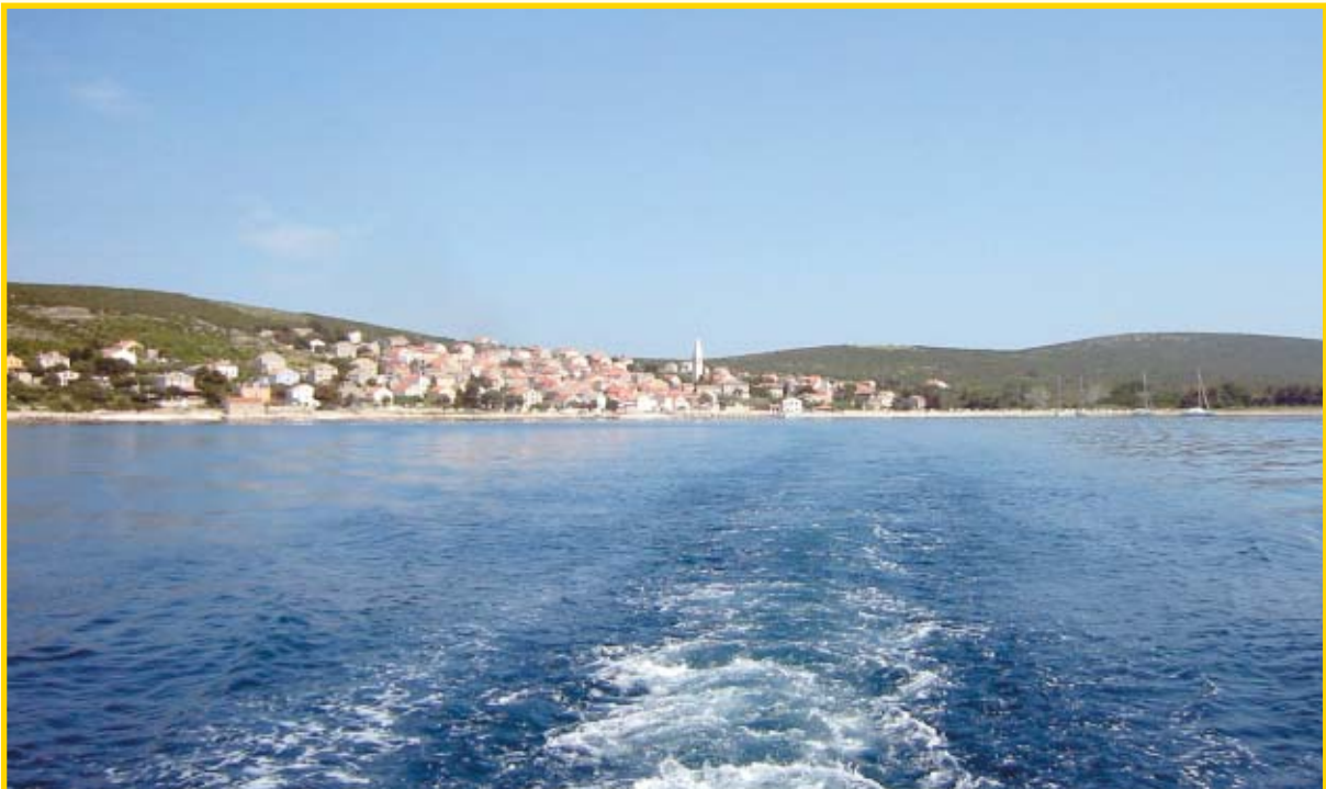
Mjesto Unije na istoimenom otoku