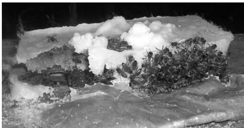
Pčele na šećernoj pogači

Bailey je također pronašao da osam godina stari med može izazvati dizenterične učinke snažnije nego sami šećeri: apsorpcija HMF je maksimalno korelativna s toksičnošću starog meda i acidohidroliziranih sirupa. Testovi (Jachimowicz i El Sherbiny, 1975; Barker, 1976)