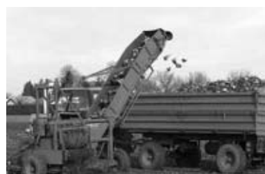
Šećerna repa

Ali, i med i nektar sadržavaju u tragovima toksične šećere, kao što su rafinoza, manoza i galaktoza (Percival 1961; Sid-