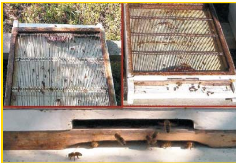
Leto matične rešetke okrenuto je na dolje

I tako matična rešetka, koja ima sasvim drugu namjenu, umjesto da pčelaru smeta tijekom zimskog razdoblja ili bude beskorisni dio košnice, nalazi novu ulogu u borbi protiv pčelinjih neprijatelja.