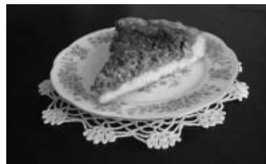
Medeni kolač

Krema: maslac, med i šećer staviti u posudu da se rastopi pa polako dodati orahe i lješnjake.