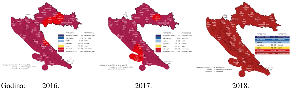
Godina: 2016. 2017. 2018. Slika 2. Odstupanje srednje temperature zraka od 2016. do 2018. godine (izvor: Državni hidrometeorološki zavod, http://meteo.hr/klima.php?section=klima_hrvatska&param=k1_4 )

U takvim uvjetima pčelinje zajednice podložnije su obolijevanju od pčelinjih bolesti, a zbog nesigurnih i nestalnih izvora hrane u prirodi pčelinje zajednice ne mogu opstati bez intervencije pčelara što iziskuje dodatne financijske troškove pčelarima.